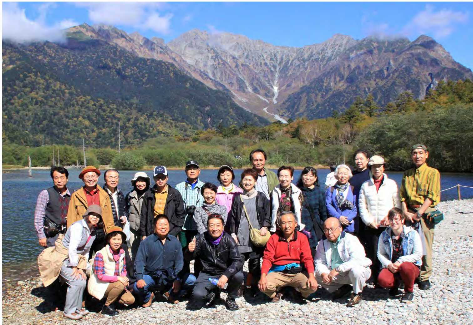
2 日目の上高地ハイキングは最高のお天気でした。大正池からの穂高連峰や焼岳の絶景は何度来ても見飽きる事はありません！