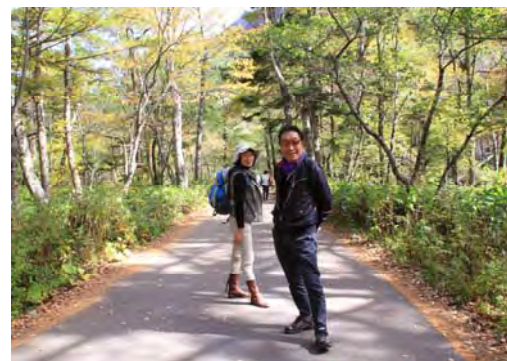
大正池から田代池、さらに梓川の清流を眺めながらカラマツ林の中を抜けて河童橋までのハイキングは秋を満喫することができました。