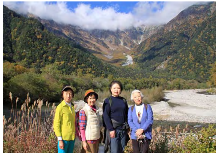
20 周年記念旅行の昼食は「上高地帝国ホテル」。今回は大勢の奥様方も参加、皆さん大満足でした。 会報:内山明夫