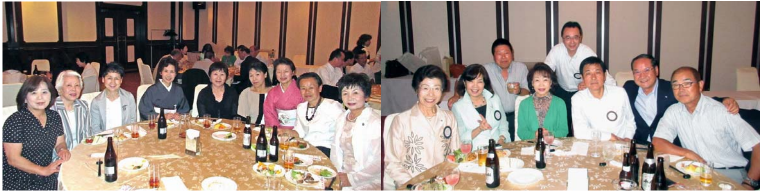
チャーターメンバーから新入会員、会員の奥様やご家族の皆さん、交換留学生・米山奨学生・皆さん満足の 1 年間でした！