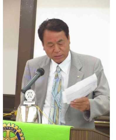
/次年度小久保委員長報告