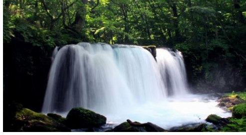
奥入瀬最大の銚子大滝