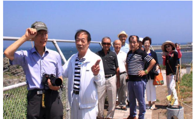
3 日目は八戸へ 国の天然記念物 ウミネコの島「燕島」(かぶしま) 地元の高校生達がボランティアのガイドをしてくれました。