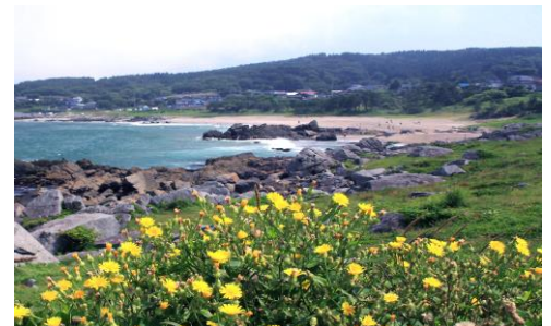
青森出身の長谷地会員がどうしても皆さんに観て頂きたかった美しい「種差海岸」です。 内山委員長も昔、絵に描いた風景です。 東日本大震災では 5.3mの大津波に襲われましたが 美しい芝生の海岸は今も変わらずとても見事です。 会報:写真:内山明夫