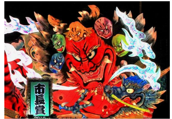
ねぶた祭りの会場で青森のゆるキャラ「決め手君」 見事なねぶた祭りを有難うございました。 迫力と熱気に大興奮でした。