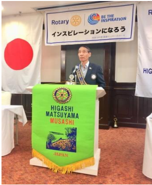
清水会長、会長の時間