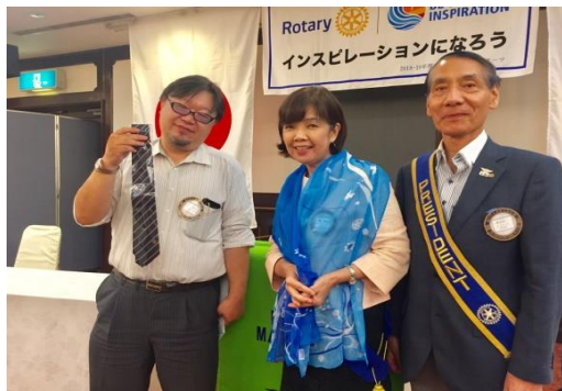
笠原会員もおめでとうございます!