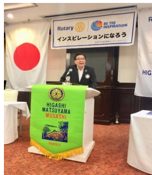
小澤ガバナー補佐報告