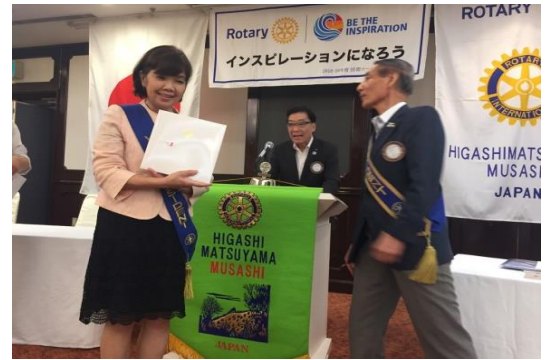
お誕生日おめでとうございます