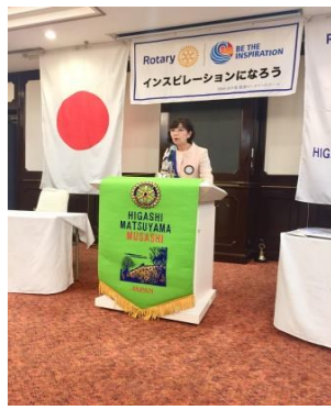
小藤幹事、幹事報告