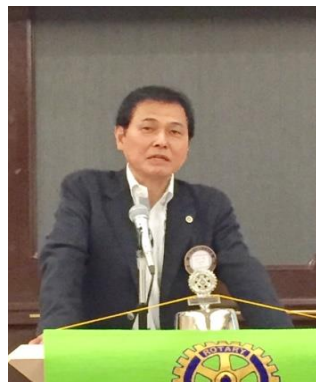
ベトナムコンサートをお願い