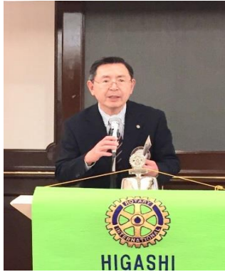
職業奉仕について報告