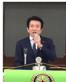
宮村会員の卓話 スライドを利用してお話をしました。