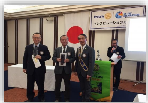
お誕生日おめでとうございます!