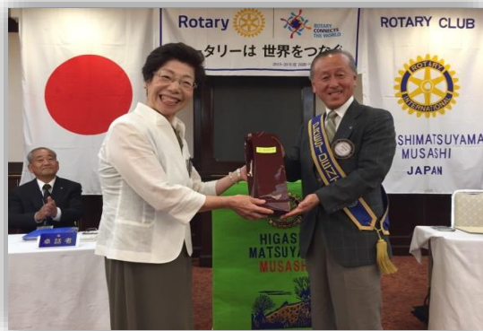
盛島会員、お誕生日おめでとうございます