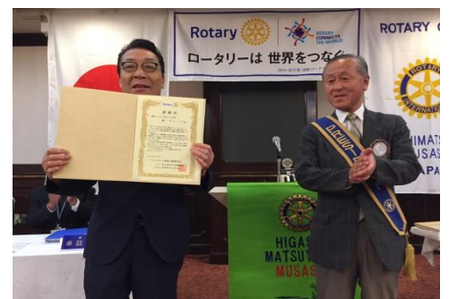
市長様から感謝状を頂きました。