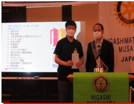
財団委員長 盛島会員