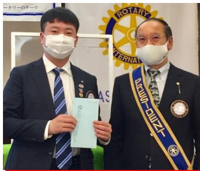
ソウ君へ米山奨学金授与