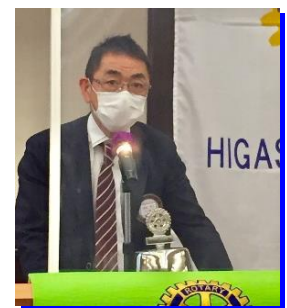
菊池会計決算報告